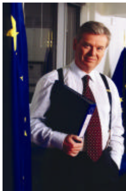
David Byrne Europejski Komisarz ds. Zdrowia i Ochrony Konsumenta